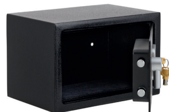
Incluye 2 Llaves